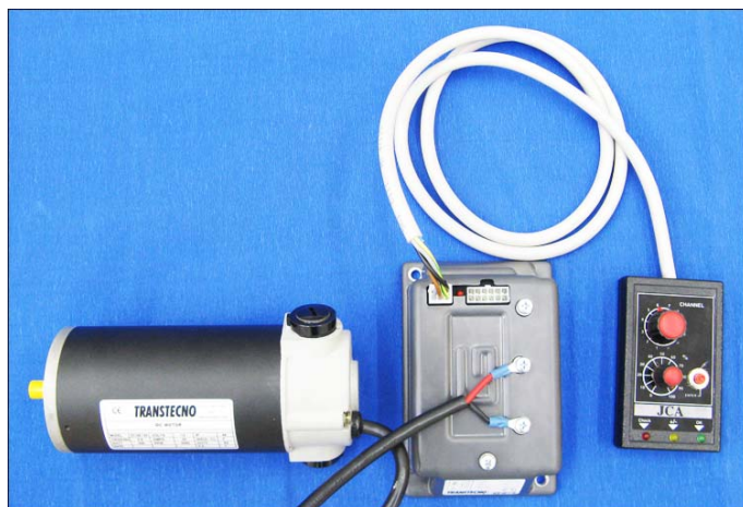
Gleichstrommotor Serie EC mit Regleinheit PLN und Programmierereinheit TDA12